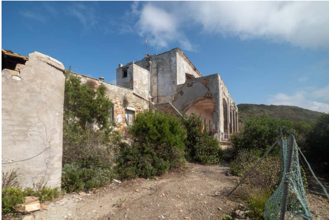
Pavillon de chasse