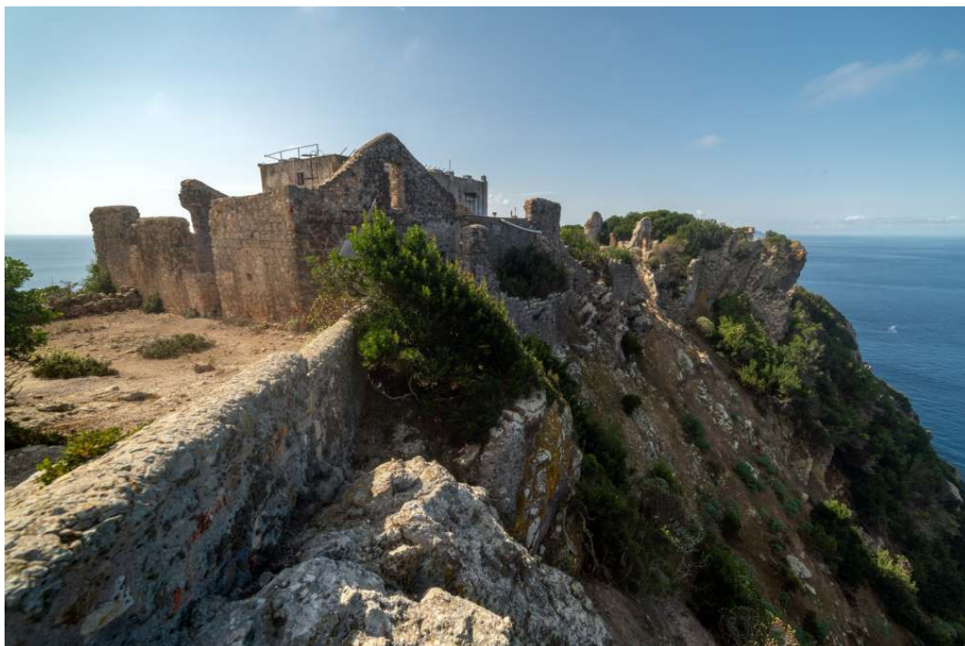
Ruines du monastère cistercien