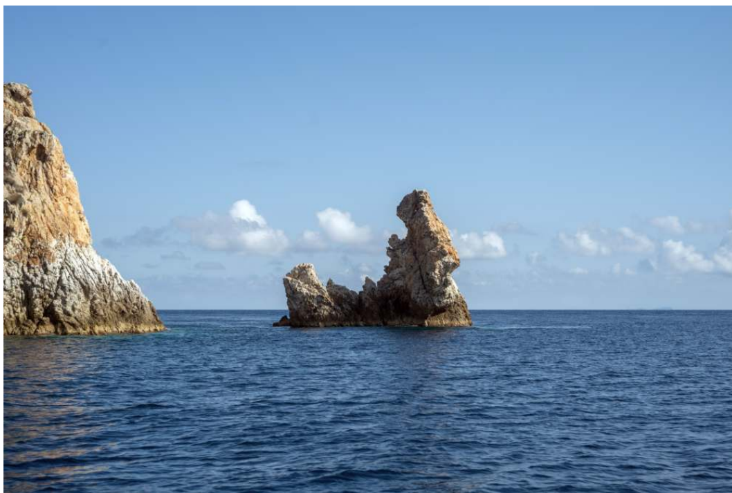
La Roca del Monje

La circunnavegación de la isla termina con la vista de la Roca del Monje , una evocadora formación rocosa que emerge del mar. El nombre probablemente deriva de su forma que recuerda la silueta de un monje encapuchado.