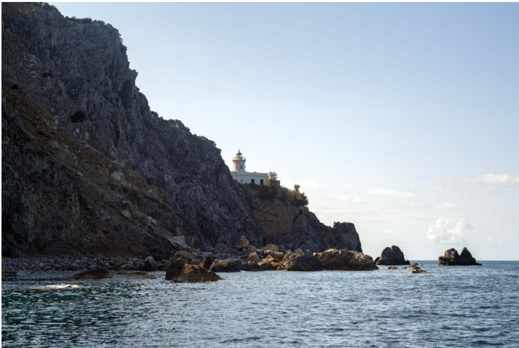
Faro de Capo Negro

Continuando la navegación se puede admirar el Faro de Capo Negro , que domina el acantilado. Arriba se pueden ver los restos del monasterio cisterciense. El faro es un importante punto de referencia para la navegación en estas aguas.