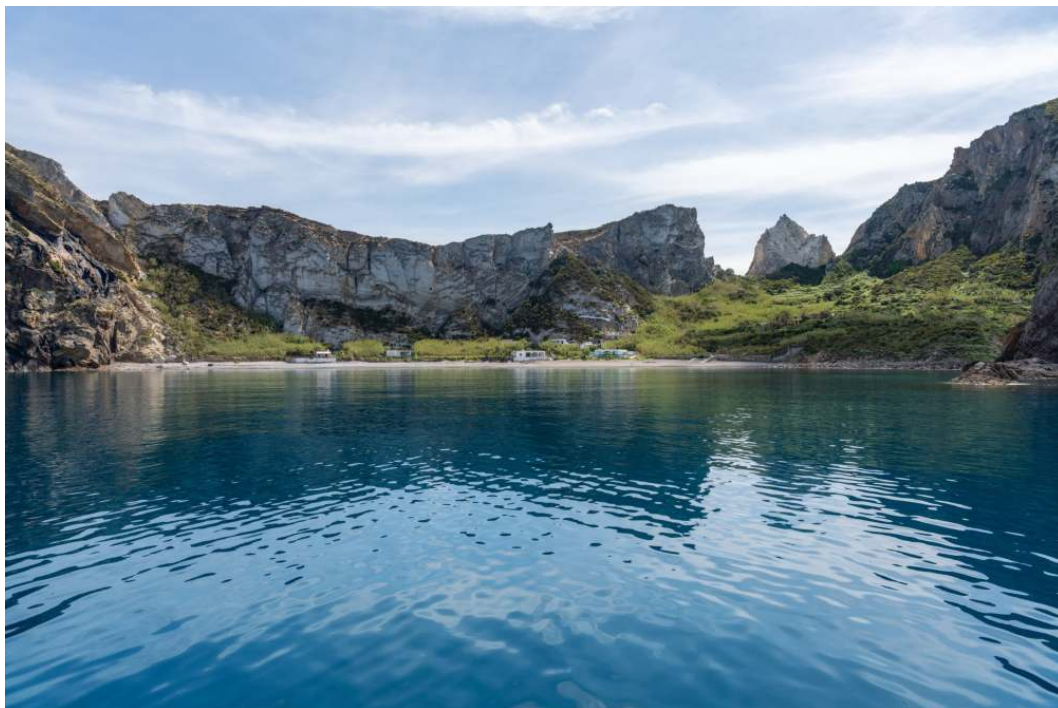
Faraglione di San Silverio