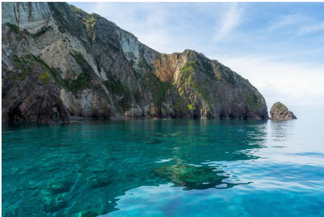
Pasaje del Mediodía