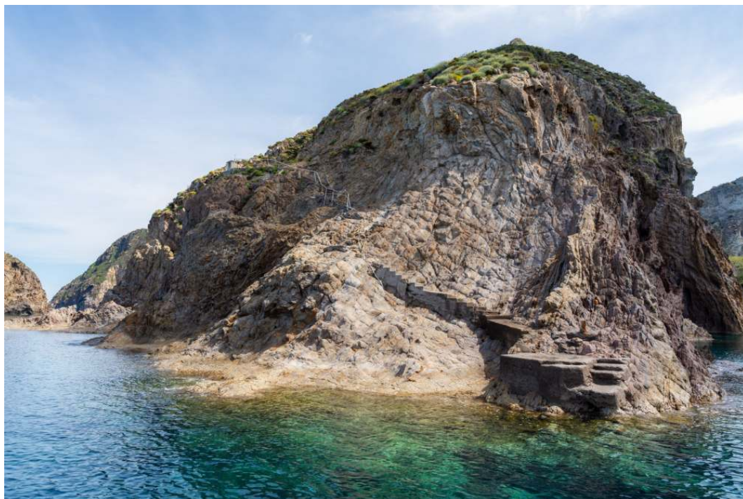
La Llanura del Viaje

La Llanura del Viaje es una zona plana de la isla donde en el pasado solían detenerse viajeros y pescadores. Esta área representa uno de los pocos puntos donde es posible desembarcar y caminar por la isla.