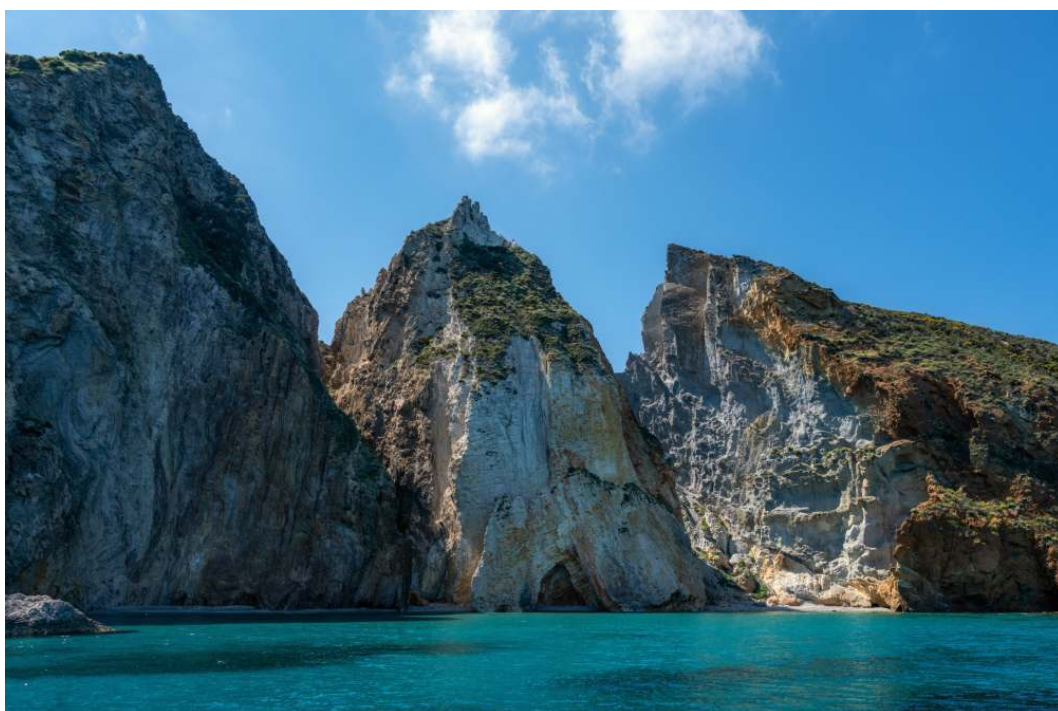
Palmarola vista desde el mar

NOTA: Recuerden que la playa de Palmarola no tiene servicio de recogida de basura: todo lo que traigan a la isla debe ser llevado de vuelta a bordo y desechado al regresar a Ponza. Vuelvan al barco con los pies enjuagados sin piedrecitas.