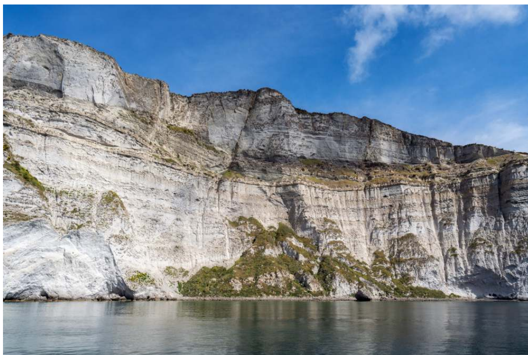
La isla de Palmarola